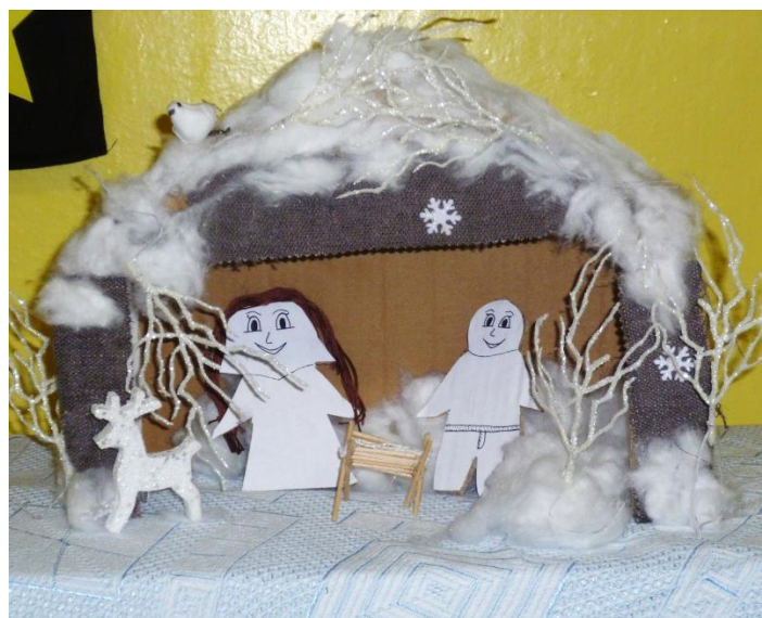
Číslo doprovázejí ukázky z vánoční výstavy žáků základní školy v prosinci 2015.