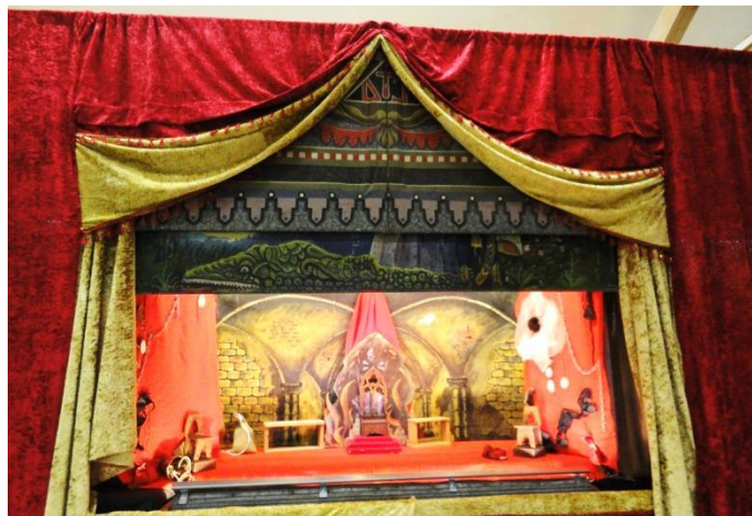
Putovní scéna Loutkového divadla Oblázek

Příjemné prožití svátků vánočních a do nového roku 2017 vše nejlepší přejí členové loutkářského souboru.