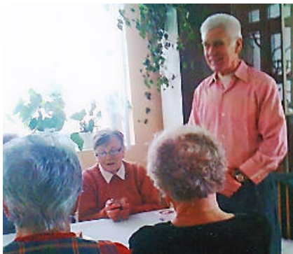
zaměstnankyně PS Krucemburk

S potěšením sledujeme velký zájem o všechny akce. Účastníci se aktivně zapojují a užívají si společné chvíle strávené povídáním i kreativní činností. Tímto všem, kteří se našich aktivit účastní, děkujeme a těšíme se na další setkání.