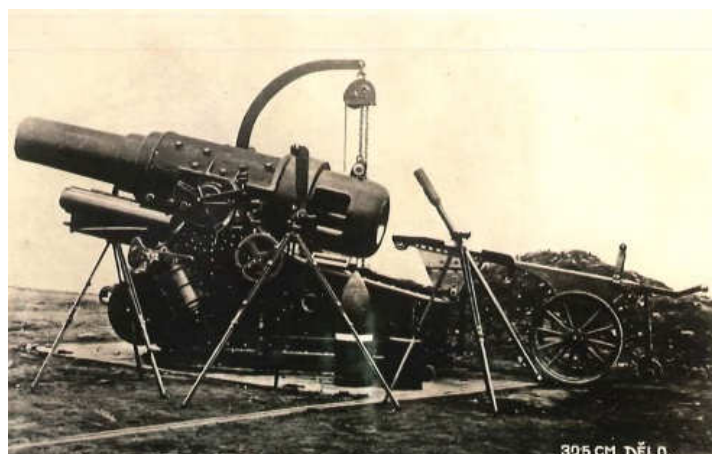
Těžké dělo ráže 30,5 cm neboli moždíř se vyrábělo ve Škodových závodech v Plzni. Střely do tohoto hmoždíře se odlévaly také v Janáčkově strojárně ve Starém Ransku.