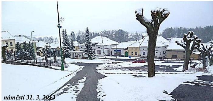
náměstí 31. 3. 2013

Počasí během ledna bylo velmi proměnlivé. Od 11. ledna se velmi ochladilo a začala se utvářet sněhová pokrývka. Ta dosáhla výšky 10 cm a v následujících dnech se o 2 cm zvýšila. Před koncem měsíce se však vlivem oteplení stala nesouvislou. Další ochlazení nastalo po 8. únoru a trvalo až do 24. února: toho dne dosáhla sněhová pokrývka výšky 22 cm. Další oteplení však znamenalo, že za dva dny byla nesouvislá a 8. března již sních zcela zmizel. Až do neděle 12. března bylo poměrně teplo a toho dne vystoupila odpolední teplota až na 12 stupňů. Během odpoledne se však zatáhlo a přišla první bouřka. Následovalo opět ochlazení, které trvalo až do poloviny dubna. V tomto období se také několikrát utvořila slabá sněhová pokrývka, která však neměla dlouhého trvání.