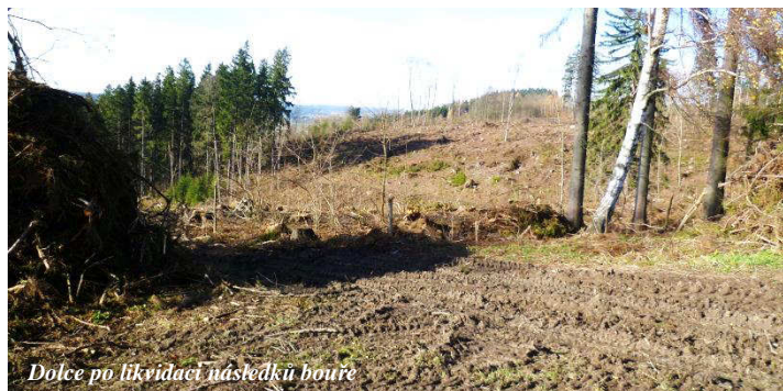
Dolce po likvidaci následků bouře

podél silnic a cest. Od 30. července byl zakázán vstup do lesů. Bouře způsobila i krátkodobý výpadek elektrického proudu. K poškození domů v Krucemburku však nedošlo, neboť největší síla větru se projevila v těsné blízkosti východně od městyse.