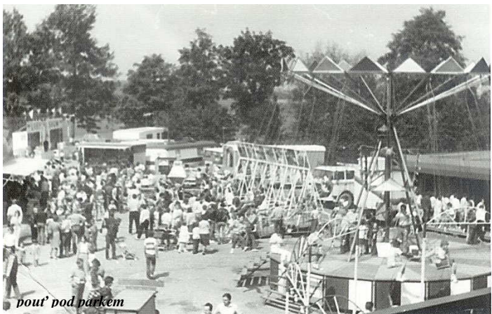
pouť pod parkem

Později, když se začala přestavovat silnice, byla pod parkem vybudována v rámci objížďek nová komunikace a mokrá louka byla zavezena výkopovým materiálem ze silnice. Vzniklo tak nové, velké místo pro pořádání pouti. Později byla pro pouť využita i přilehlá louka. O pouti se tak část ranecké silnice u parku a ulice Na Liškově přemění na místo pro stánky, zejména vietnamských obchodníků.