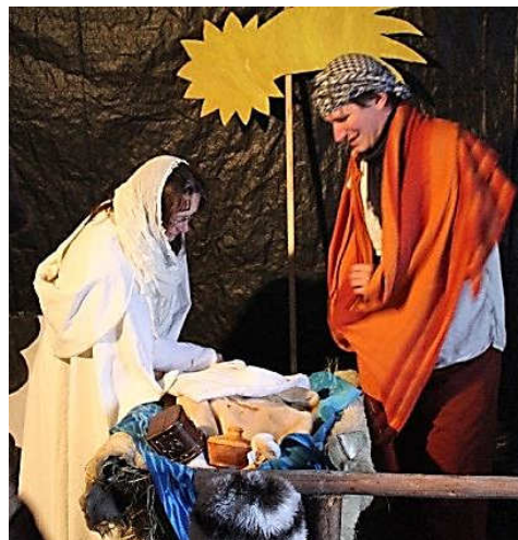
Živý Betlém (25. 12. 2012)