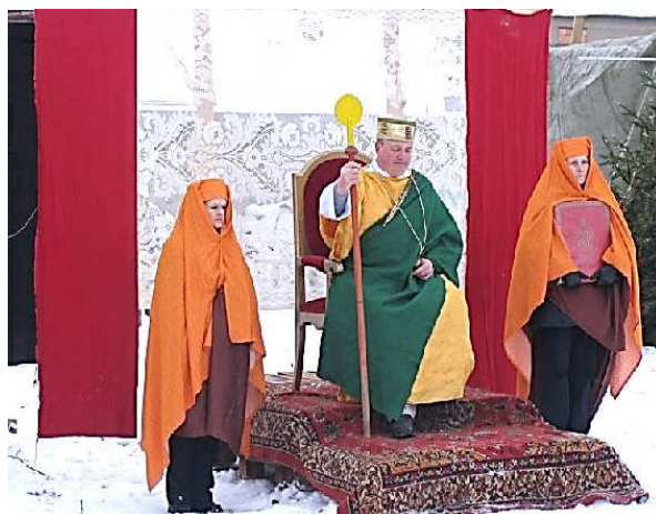
divadelní hra Čtvrtý z mudrců (13. 1. 2013)