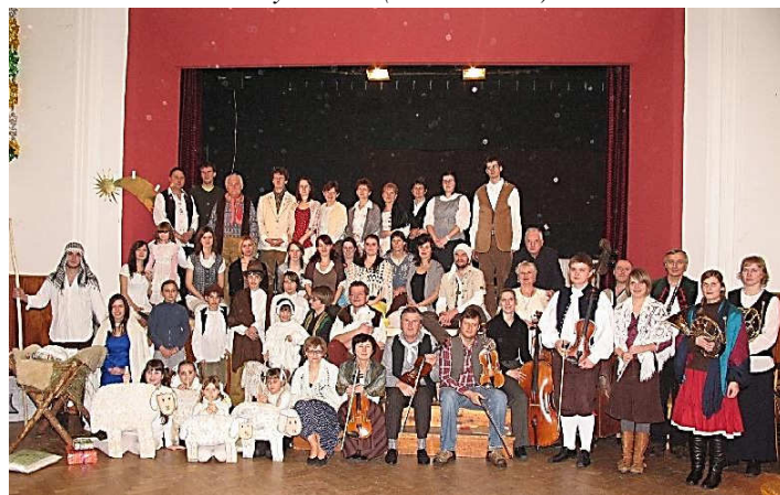
Vánoční koncert (26. 12. 2012)