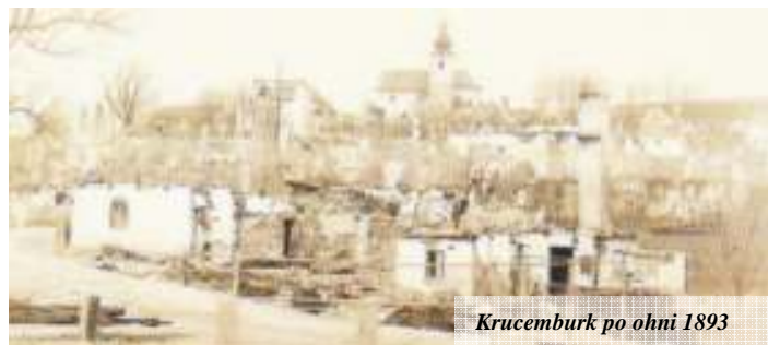
Krucemburk po ohni 1893

V roce 1866 vypukla prusko-rakouská válka, opět zde bylo mnoho vojska. Napřed císařská rakouská armáda, po ní Prusové – Prajsové se jim říkalo. Nastalo další placení, dodávání zásob a