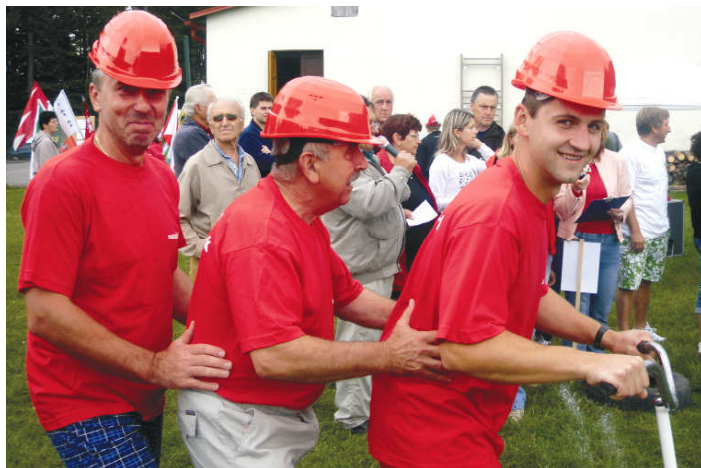
naši zastupitelé na koloběžce