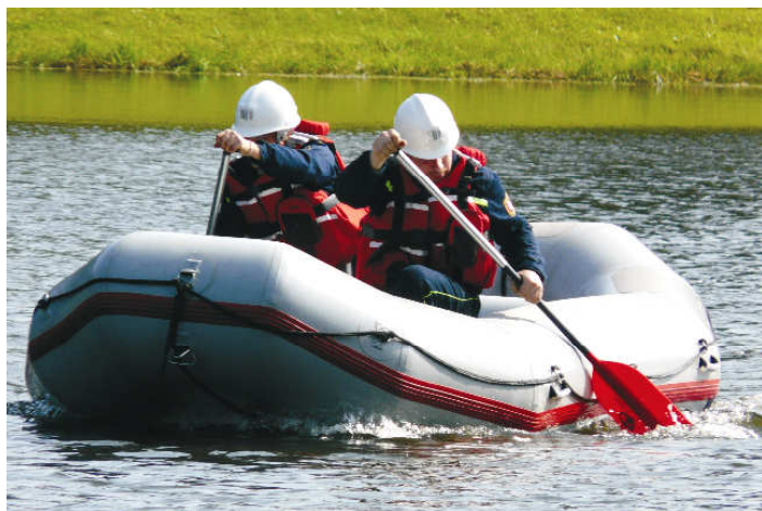
naši hasiči v akci