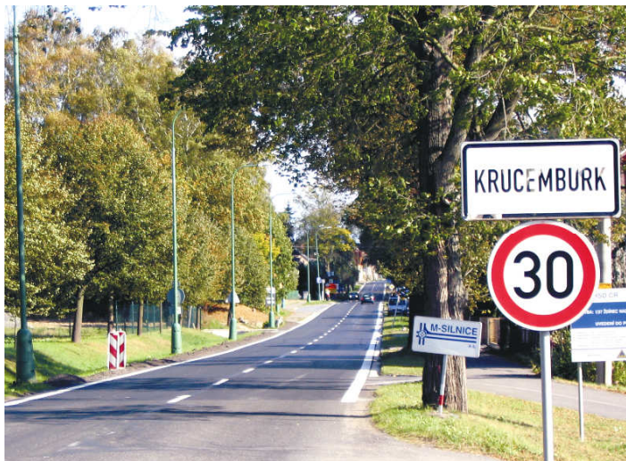
nová hlavní silnice