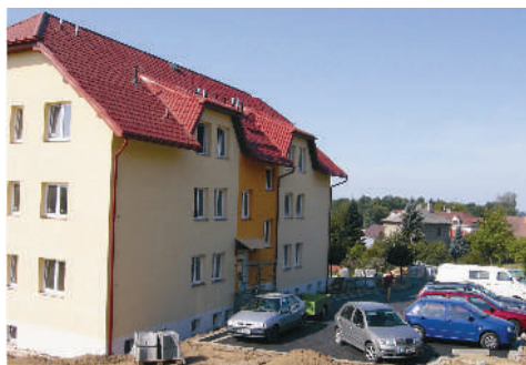
nový bytový dům ve Školní ulici

ale to jim neubírá na důležitosti. Výstavba kanalizace dala nám všem opravdu zabrat a všichni se těšíme, až tato historicky největší výstavba bude za námi. Objevily se nové možnosti bydlení a další bytové výstavby, rozšířily se příležitosti k budoucímu budování parcel a udělala se spousta dalších a dalších věcí. A právě na to, co se tento rok v našem městyse povedlo, nebo naopak nepovedlo a jaké jsou další plány, jsme se zeptali pana starosty.