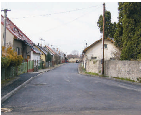
první dokončená část ulice Na Liškově

Blíží se konec roku a lidé rekapitulují, co se jim za uplynulý rok podařilo, co se mohlo podařit lépe a jaké závazky a plány si ponесou do toho dalšího roku nového. V našem městyse se tento rok událo hodně věcí a některé z nich se opravdu nedaly přehlédnout. Jiné naopak nebyly na první pohled vidět,