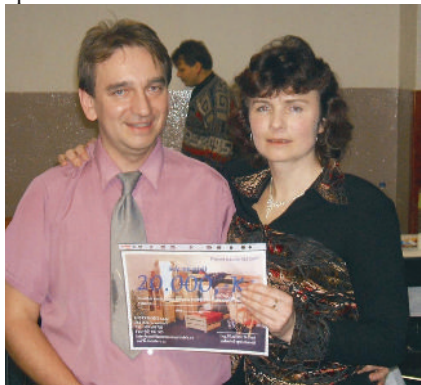
Vítězové první ceny – šek na nákup nábytku za 20.000,-Kč

17. února 2007 se uskutečnil v krucemburské sokolovně VII. obecní ples, který se dle ohlasu Vás občanů líbil a vydařil. Za úspěchem stojí především kapela a hlavně bohatá tombola, kterou celou věnovali naši sponzoři.