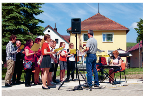
V sobotu 19. května 2018 odpoledne zpíval Chrámový pěvecký sbor Krucemburk na slavnostním svěcení restaurované sochy svatého Jana Nepomuckého ve Vojnově Městci.