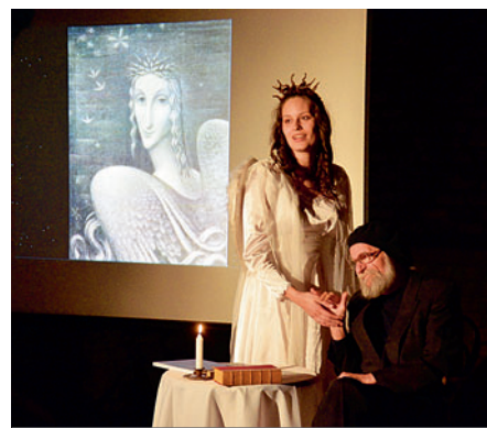
Anděl jako postava divadelní hry o malíři Janu Zrzavém.

jeho obrazy. Název Kruceburk a Okrouhlice se při těchto divadelních představeních vyskytoval velmi často, takže není divu, že mnozí z našich diváků také následně navštíví Vysočinu, aby si prohlédli zajímavosti a pamětihodnosti obou uvedených míst.