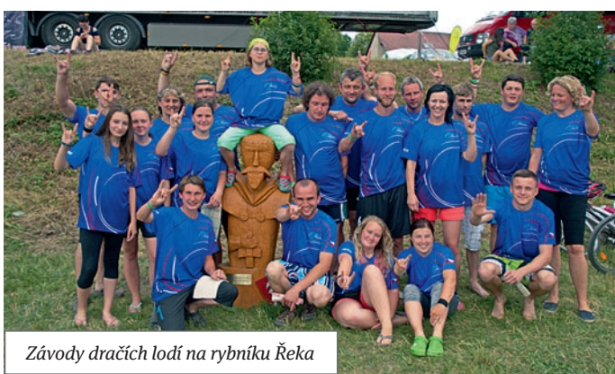
Závody dračích lodí na rybníku Řeka