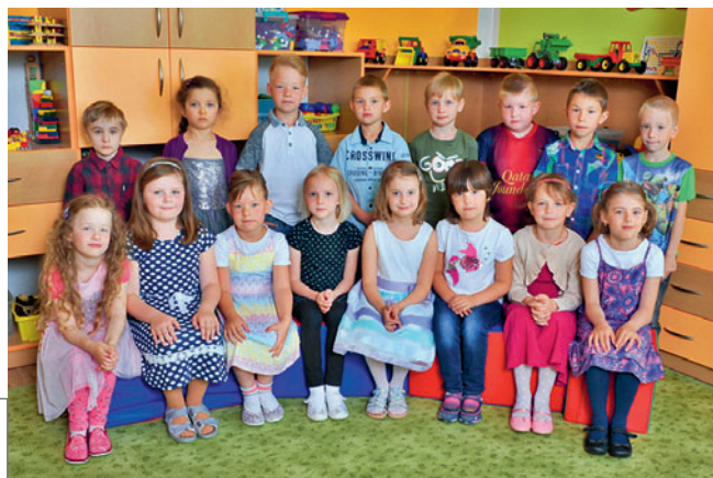
Předškoláči MŠ Krucemburk 2017–2018