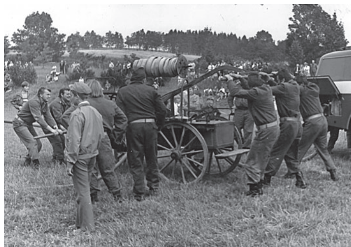
Stará stříkačka na oslavách stého výročí založení sboru (1978).