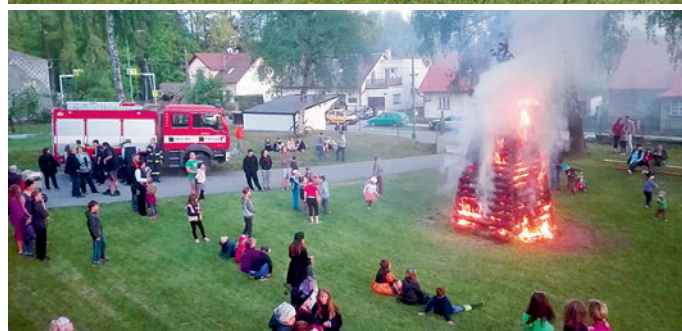
30. dubna se v areálu sokolovny konala tradiční akce: Pálení čarodějnic.