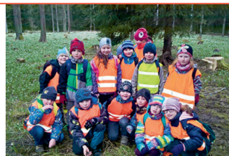
Žáci 1. stupně v NPR Ransko.

a cyklisty v silničním provozu, vybavenost jízdního kola a znalost dopravních značek. V teoretické výuce se dále zaměřili na řešení dopravních situací na různých křižovatkách. Své znalosti si děti vyzkoušely a po úspěšném napsání testů získaly průkaz cyklisty. 1. června si všichni žáci v rámci projektového dne Dopravní výchova mohli vyzkoušet svoje znalosti o dopravních značkách, pohybu po chodníku i komunikaci, povinnosti cyklisty i řidičů na křižovatkách a zkusit si nějaký ten dopravní testík. Preventivní programy Krajského ředitelství policie Kraje Vysočina byly připraveny pro 7. a 8. třídu s názvem Bude mi 15 let a pro 2. a 3. třídu Bezpečně do školy a na ulici. Zde žáci získali další cenné informace a poučení ze zkušeností přednášejících. Odtud mohli žáci načerpat i poznatky k projektovému dni Ochrana člověka za mimořádných událostí. V terénu i ve třídách si opět všichni prozkoušeli první pomoc, obvazo-