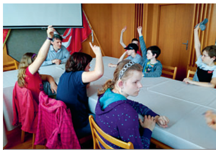
Návštěva žáků 6. třídy na ÚM.