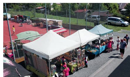
27. května se konal v areálu sokolovny 18. ročník Krucemburského jarmarku.