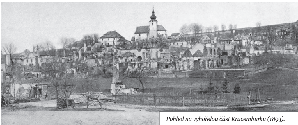
Pohled na vyhořelou část Krucemburku (1893).

Činnost se však neomezovala jen na výcvik a zásahy při požárech, ale sbor vedl i bohatý spolkový život (roku 1882 první spolkový výlet do Hati), společné návštěvy kulturních akcí (v říjnu 1881 oslavy sedesátých narozenin K. Havlíčka Borovského v Borově), účast na oslavách hasičských sborů (1885: Polná, Chotěboř), hasičských cvičení v okolních obcích aj. První hasičský ples se konal roku 1883.