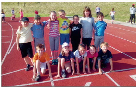
Lehkoatletické závody školních družin v Chotěboři.