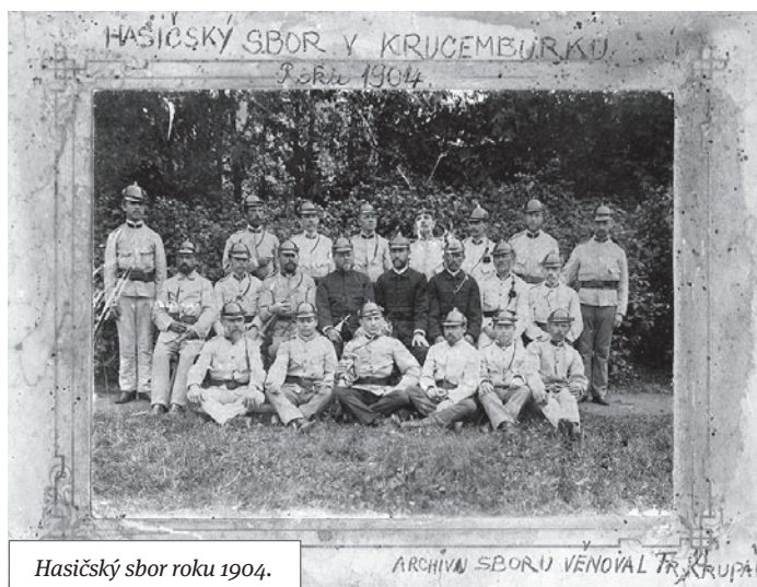
Hasičský sbor roku 1904.

Pád Bachova absolutismu uvolnil společenské poměry v rakouské monarchii. Roku 1861 byly přijaty zákony o právu spolčovacím a shromažďovacím. Na venkově docházelo postupně k shromažďování jedinců, kteří se snažili požárům předcházet, a ti začali ustavovat od poloviny 19. století v Čechách a na Moravě dobrovolné hasičské sbory. Za první z nich je považován německý Spolek dobrovolných hasičů Zákupy (1854), první český hasičský sbor vznikl ve Velvarech (1864). Do roku 1875 jich vzniklo přes sto. Roku 1876 pak byl vydán Řád policie požárové , který stanovil povinnosti v protipožární ochraně, mj. organizovat v obcích nad sto popisných čísel sbory dobrovolných hasičů se stříkačkou. První placený hasičský sbor byl ustaven v Praze (1853).