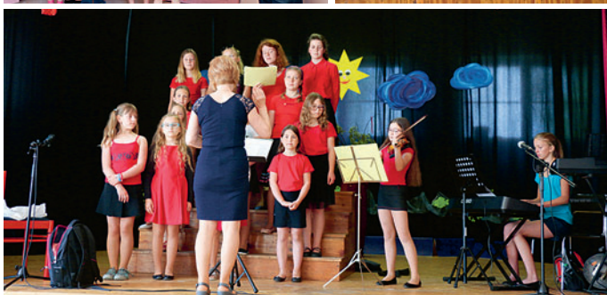
13. května – besídka ke Dni matek v sokolovně.