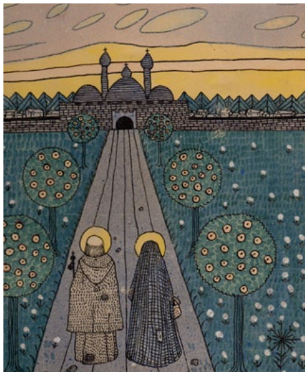
Fotografie obrazu Jana Zrzavého „K Betlému“

„Rodinný pokoj jsem měl moc rád – vysoká okna s okenicemi, lepili jsme na ně panáčky a panenky vystříhané ze starých novin, když se vystřihovánka roztáhla, bylo jich hned 10. Nebo jsme si sami namalovali