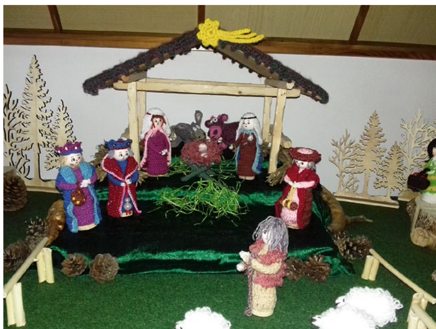
Háčkovaný betlém (autorka Naďa Plíšková)