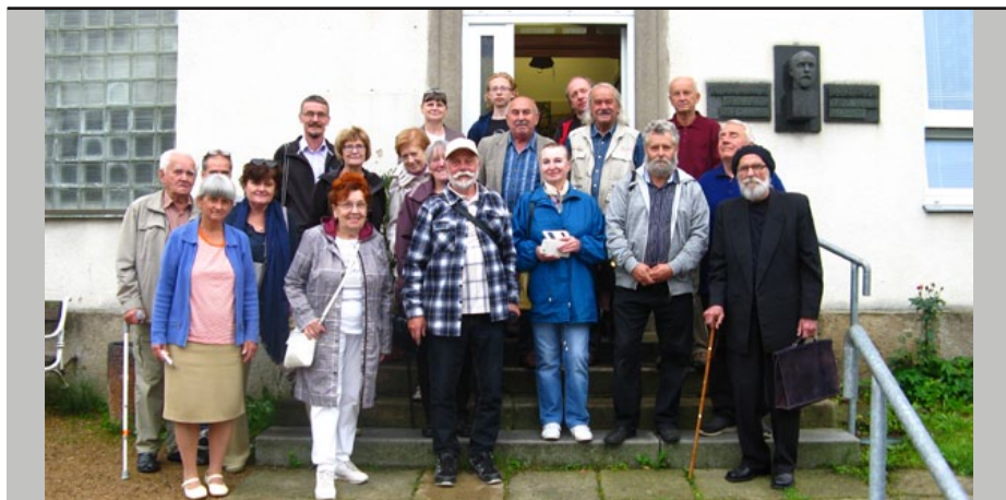
Před rodným domem Jana Zrzavého v Okrouhlici

Příjemné prožití svátků vánočních a do nového roku 2020 vše nejlepší přejí členové loutkářského souboru.