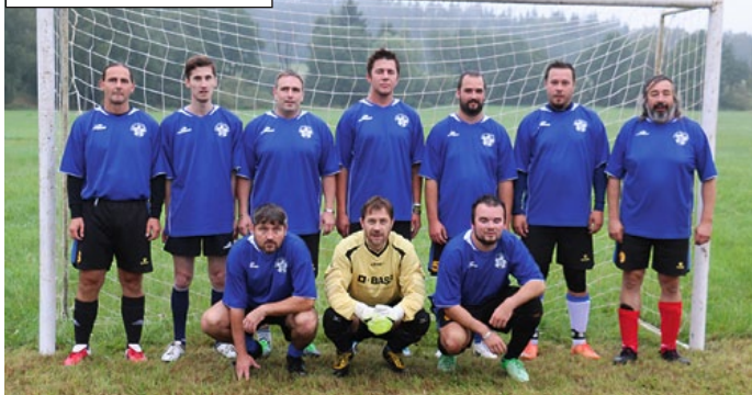
22. ročník Perun cupu