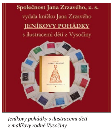
Jeníkovy pohádky s ilustracemi dětí z malířovy rodné Vysočiny

Společnost Jana Zrzavého vydala v Krucemburku k uctění 130. výročí narození Jana Zrzavého knížku „Jeníkovy pohádky“. Jsme rádi, že se nám podařilo náš dlouhodobý úmysl vydat tuto knížku s ilustracemi dětí z Vysočiny.