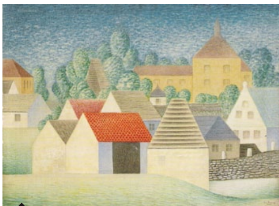
J. Zrzavý: Okrouhlice, 1960, Galerie výt. umění v Chebu Jan Zrzavý: Maria s dítětem, nedatováno