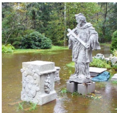
Restaurování sochy ve Svatce

ky a tmely, včetně nevhodných betonových výplní a zbytků spárovacích hmot. Poškozené a chybějící partie byly doplněny umělým kamenem (minerálním tmelem) odpovídající barvy a struktury. Doplněné partie byly plasticky a barevně retušovány dle okolní autentické horniny s odpovídající strukturou. Svatozář byla opravena ve stávající podobě obruče s pěti hvězdami, chybějící hvězda byla doplněna. Byl aplikován nový nátěr a povrch přezlacen plátkovým zlatem. Na závěr byla provedena konzervace a hydrofobizace povrchu kamene.