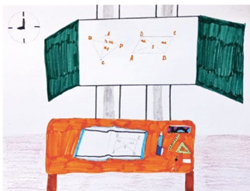
Olga Marková, 7. B ZŠ Nuselská HB