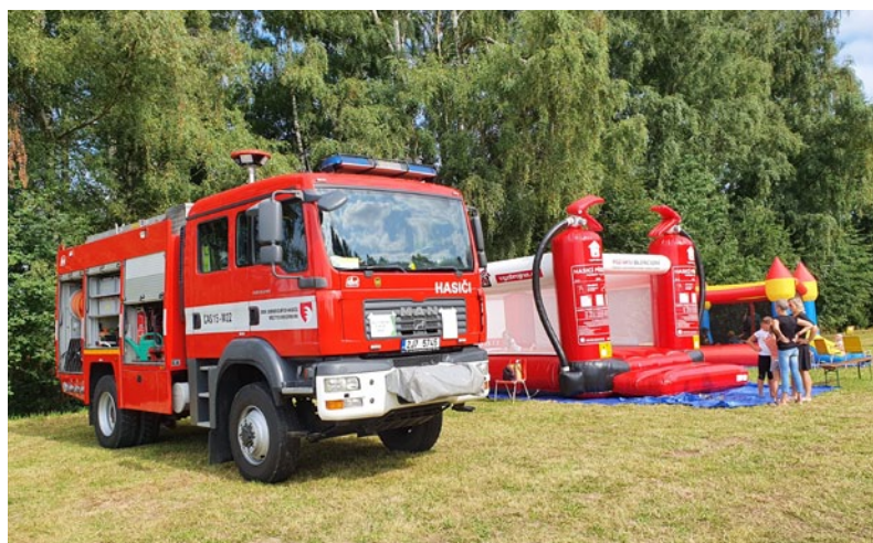
Výstava techniky, skákací hrady a další aktivity organizované SDH Krucemburk