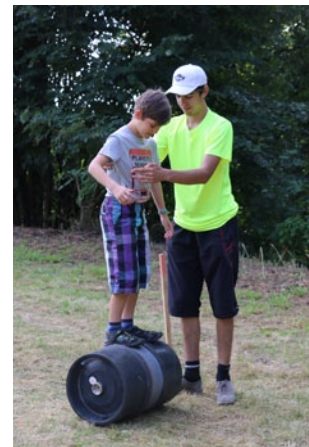
SHM Klub – válení sudů