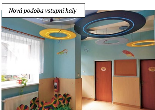
Nová podoba vstupní haly

Školku navštíví Barbora, Mikuláš, čert s andělem a vyvrcholením projektu bude 9. prosince v 15.30 hodin divadelní představení pro veřejnost, které zahrají naše děti pod názvem „Od Barbory po Štěpána“, zakončené společným zpěvem koled v místní sokolovně; organizováno bude ve spolupráci s Městyssem Kruceburk a TJ Sokol Kruceburk.