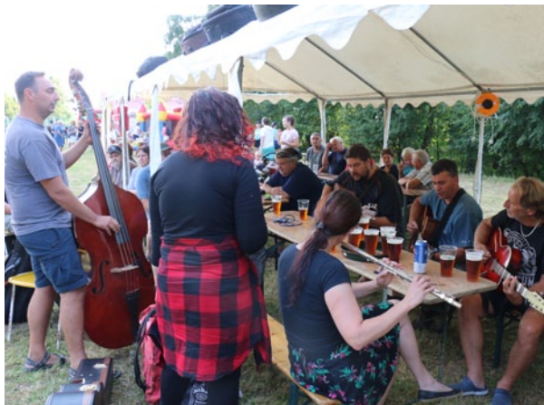
Tramprská osada Řeka hraje v sobotu v podvečer

Chtěl bych touto cestou poděkovat za spolupráci při organizaci oslav všem zaměstnancům obce, členům Sboru dobrovolných hasičů, TJ Spartak Staré Ransko,