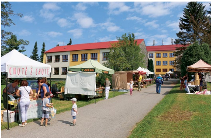
Součástí oslav byl 21. srpna již 20. ročník trhu řemesel Krucemburský jarmark. Uskutečnil se tentokrát podél cesty ke škole, kde ve dvanácti stáncích prodávali trhovci své řemeslné a umělecké výrobky.