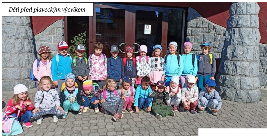
Děti před plavečným výcvikem