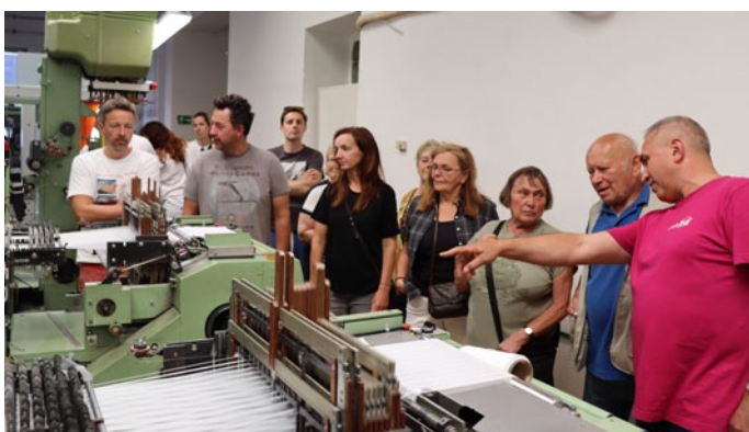
V pátek a sobotu si mohli zájemci prohlédnout závod Elasta-Vestil