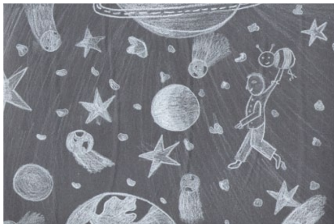
Sára Wagnerová, 4. ročník, ZŠ Krucemburk