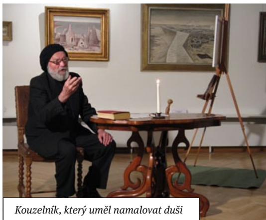
Kouzelník, který uměl namalovat duši