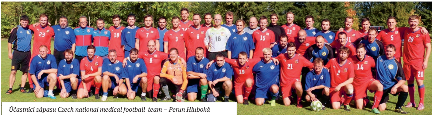
Účastníci zápasu Czech national medical football team – Perun Hluboká