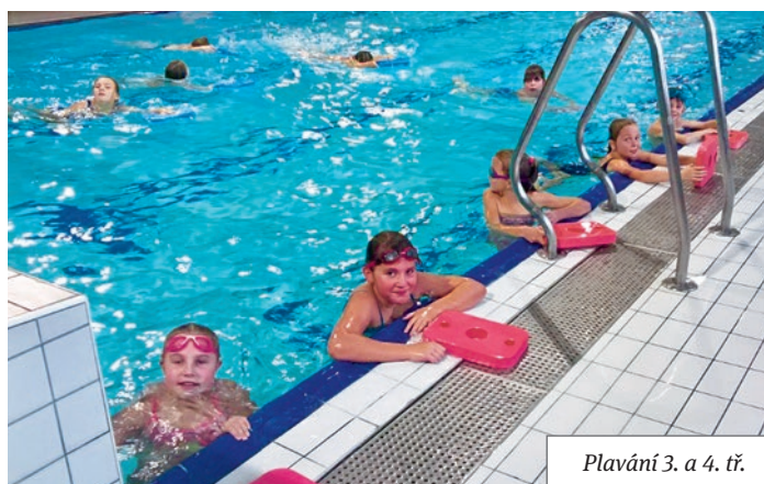
Plavání 3. a 4. tř.

PF 2019 Radostné svátky vánoční a šťastný nový rok