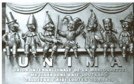
Bohumír Koubek: Pamětní deska UNIMA, 1979

Obě profese Bohumíra Koubka – sochařská i loutkářská – se prolínají v bronzové Pamětní desce UNIMA, která zdobí vchod do divadla Říše loutek v Praze na Žatecké ulici, kde byla roku 1929 ustavena Mezinárodní loutkářská unie UNIMA (Union internationale de la Marionnette). Roztomilé postavičky sedmi kašpárků vypočetl autor tak, jak se prezentují v různých zemích.