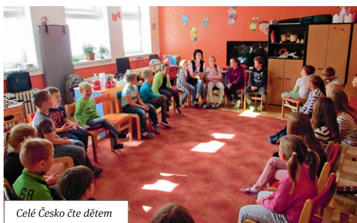
Celé Česko čte dětem