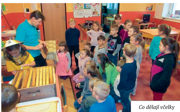
Co dělají včelky

Žáci 3. a 4. třídy se zdokonalovali v plavání v bazénu v Hlinsku. Po deseti lekcích obdrželi všichni „mokrý vysvědčení“, to znamená, že jsou z dětí plavci, kteří zvládají různé plavecké styly. Naše malé florbalistky se zapojily do Čeps cupu pro 1. stupeň ZŠ. Turnaj probíhal ve sportovní hale TJ Jiskra Havlíčkův Brod; náš tým děvčat nezklamal, vybojoval krásné 1. místo a zajistil si postup do krajského kola. Děvčata 6.–9. třídy se účastnila okresního kola ve florbalu v Havlíčkově Brodě. Kluci 5.–7. třídy sehráli okrskové kolo ve florbalu, kde se dostali do semifinále. Chlapci 5.–9. třídy odehráli okrskové kolo ve florbalu v Chotěboři, kde v silné konkurenci obsadili 4. místo.