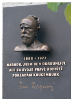
Jan Zrzavý, 1976