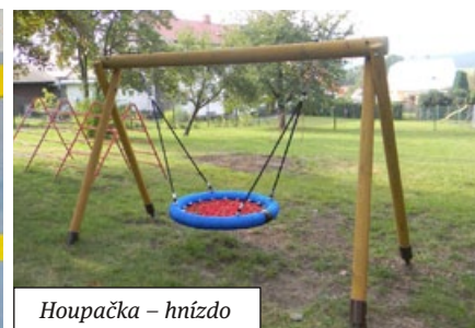
Houpačka - hnízdo

O prázdninách ve školce panoval opět pracovní ruch. Vše se opravovalo, modernizovalo, aby se děti po prázdninách vrátily do hezkého a příjemného prostředí. Byly opraveny dvě úklidové komory, částečně vymalováno, opraveno zábradlí na schodišti tak, aby odpovídalo normám i pro dvouleté děti. Venkovní úpravy – rekonstrukce dopravního hřiště a úprava vstupu do MŠ. Na zahradu byla zakoupena houpačka – hnízdo. Děkujeme všem firmám a sponzorům, kteří se na těchto úpravách podíleli.