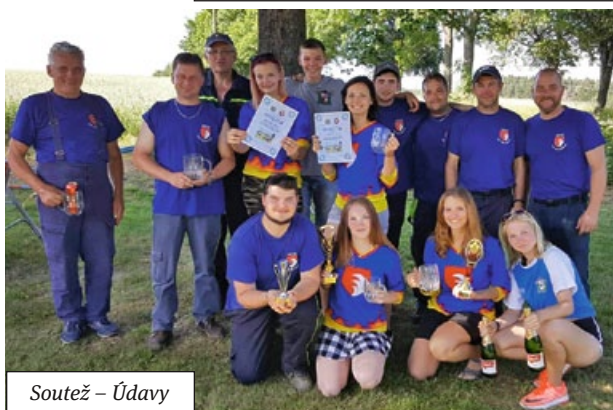
Soutěž – Údavy