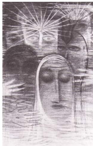
(Vpravo) Jan Zrzavý: Ilustrace – J. Zeyer, Dům U tonoucí hvězdy , 1957, Národní galerie v Praze

ženské či mužské podoby, není tu nic, co by odvádělo pozornost od podstaty hlubokého lidství a jeho čaromoci. Vzdušné, jemné linie umocňují nadčasové pojetí tohoto tématu.