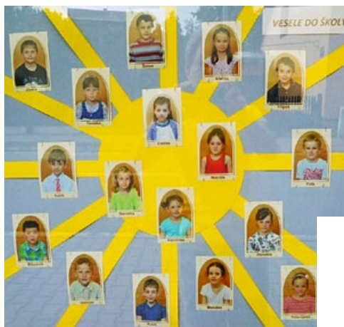
Tablo budoucích školáček

Pravidelně budou pokračovat podle tříd logopedická cvičení dětí s logopedickými asistentkami v jednotlivých třídách. Dále připravujeme ve spolupráci se základní školou plavecký výcvik pro starší děti. Ze zájmových činností mohou děti navštěvovat taneční kroužek a nebo se mohou zúčastnit lyžařského výcviku pod odborným dohledem.