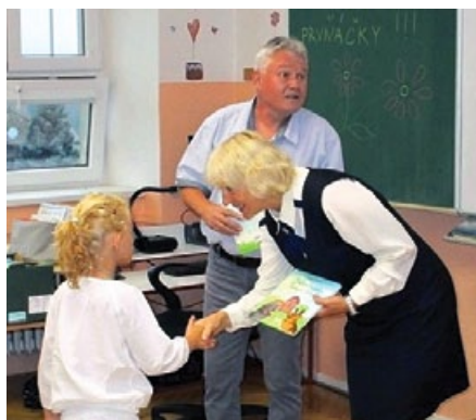
Zahájení školního roku 2019–20 v 1. třídě

Žáci mají opět možnost vybrat si z velké nabídky zájmových kroužků: Florbal chlapci i dívky pro 1. i 2. stupeň, Volejbal 2. stupeň, Školní družina – sportujeme ve škole, Výtvarný pro 1. stupeň, Turistický