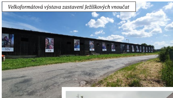
Velkoformátová výstava zastavení Ježíškových vnučat