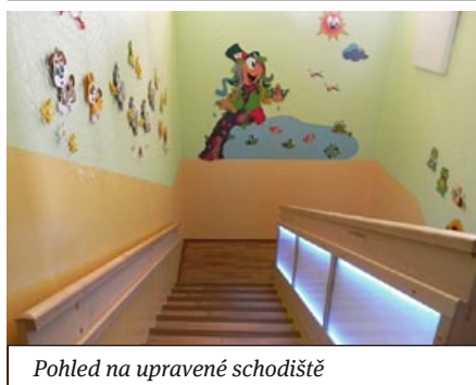
Pohled na upravené schodiště