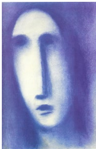
(Vlevo) Jan Zrzavý: Modrá hlava , 1974, Národní galerie v Praze

Jako příklad obrazu, který často upoutává pozornost publika, uvádím Zrzavého dílo Modrá hlava . Čtyřiaosmdesátiletý malíř vydává jasně sdělení o své celoživotní moudrosti, o neustálém směřování člověka k harmonii a o úctě k tajuplnosti lidského bytí. Obraz je plný sugestivního účinku. Lidská tvář je tu oproštěna od všeho nadbytečného, dokonce ani nejsme schopni rozpoznat atributy