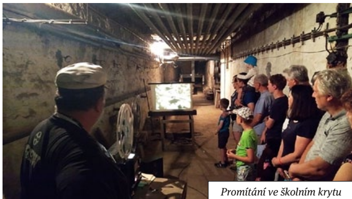
Promítání ve školním krytu