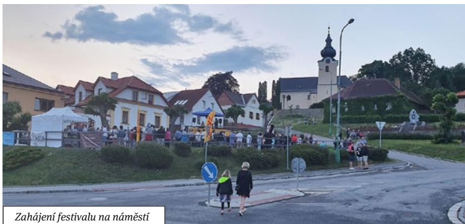
Zahájení festivalu na náměstí