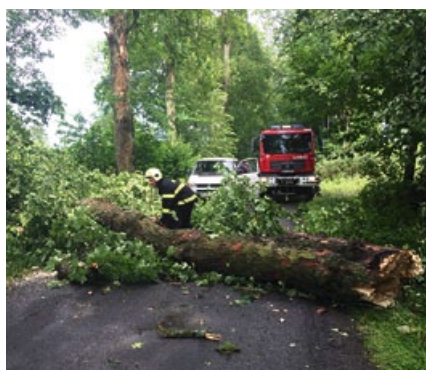
Zásah u spadlého stromu v Ranecké aleji