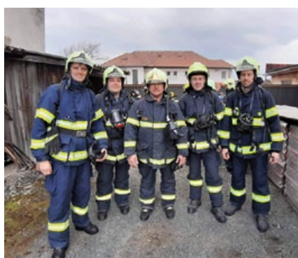
Cvičení s dýchací technikou – Maleč