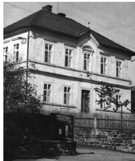
Budova bývalé mateřské školy