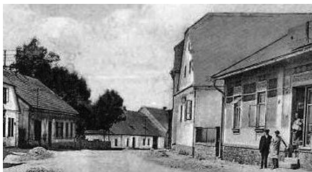
Budova bývalého poštovního úřadu ( zcela vlevo)