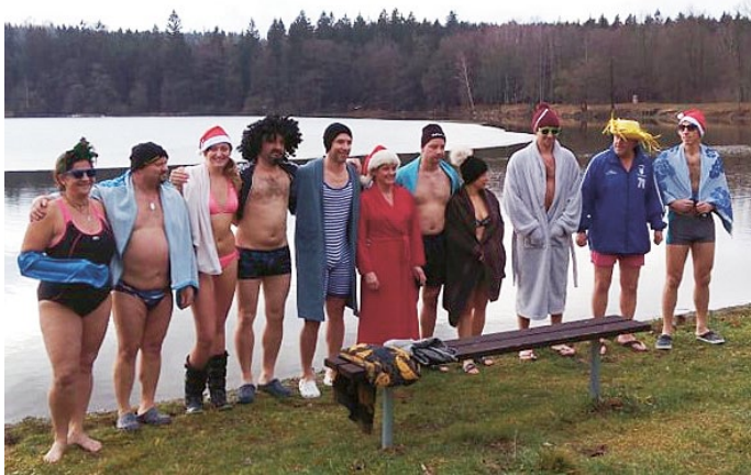
Tradiční silvestrovské koupání na Řece