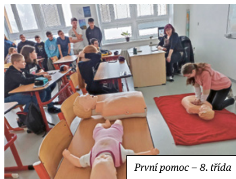
První pomoc – 8. třída

Netradiční zakončení sportovního florbalového roku pro florbalistky z 1. i 2. stupně byl „Pyžamový turnaj smíšených družstev“. Turnaj tříčlenných týmů ukázal radost ze hry a podpořil heslo: „ Není důležité vyhrát, ale co nejvíce si zahrát! “ Začátkem února odjeli vybraní žáci 7.–9. třídy na Lyžařský kurz do Daňkovic. Počasí příliš nepálo běžkařům, kteří nakonec podnikali pěší túry, protože sněh v běžecké stopě roztál a navíc pršelo. Sjezdaři na tom byli o poznání