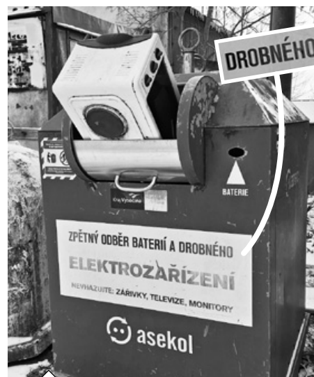
LIDSKÁ HLOUPOST NEZNÁ HRANIC