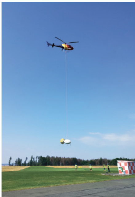
Helikoptéra s podvěsným detektorem, který měří intenzitu zemského magnetického pole

Unikátnost geologického složení společně s výskytem minerálů mědi, niklu, kobaltu a platinových kovů a také dostupnost historických dat a informací byly hlavním důvodem začlenění Ranského masivu mezi výzkumné lokality Aurumu a mezinárodního výzkumného projektu SEMACRET (další lokality se nacházejí v Polsku, Portugalsku a Finsku).