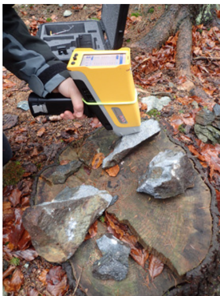
Ruční detektor umožňující okamžitou analýzu chemického složení horniny

Probíhající výzkumné práce byly rozděleny do tří hlavních etap – archivní, terénní a laboratorní. Archivní část probíhala v prvním roce výzkumu a byla zaměřena na zpracování a digitalizaci historických dat a informací. Terénní práce v rámci projektu SEMACRET byly provedeny v roce 2023 a spočívaly v odběrech povrchových vzorků půd, hornin a vegetace, a na ně navázaly dvě etapy moderního leteckého geofyzikálního výzkumu pomocí helikoptéry, které měřily magnetické pole Země ke zjištění složení hornin a případných akumulací minerálů v různých hloubkách.