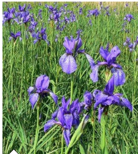
Česká botanická společnost vyhlásila rostlinou roku KOSATEC SIBIŘSKÝ .